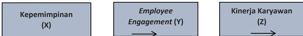
Gambar 1. Paradigma Penelitian

Dalam Era Digital ini memerlukan hubungan solid dan peran yang ekstra dari pemimpin dan karyawan. Dimana pemimpin perlu memiliki kepemimpinan yang mampu menciptakan employee engagement sehingga kinerja karyawan dapat sesuai telah ditentukan perusahaan. sehingga paradigma penelitian ini digambarkan sebagai berikut: